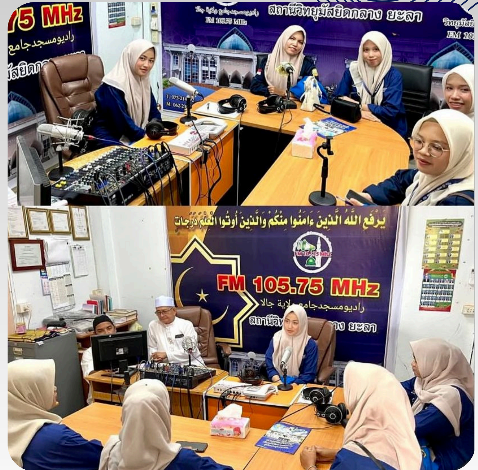
Praktik Podcast di CityRadio Yala.98 Thailand.